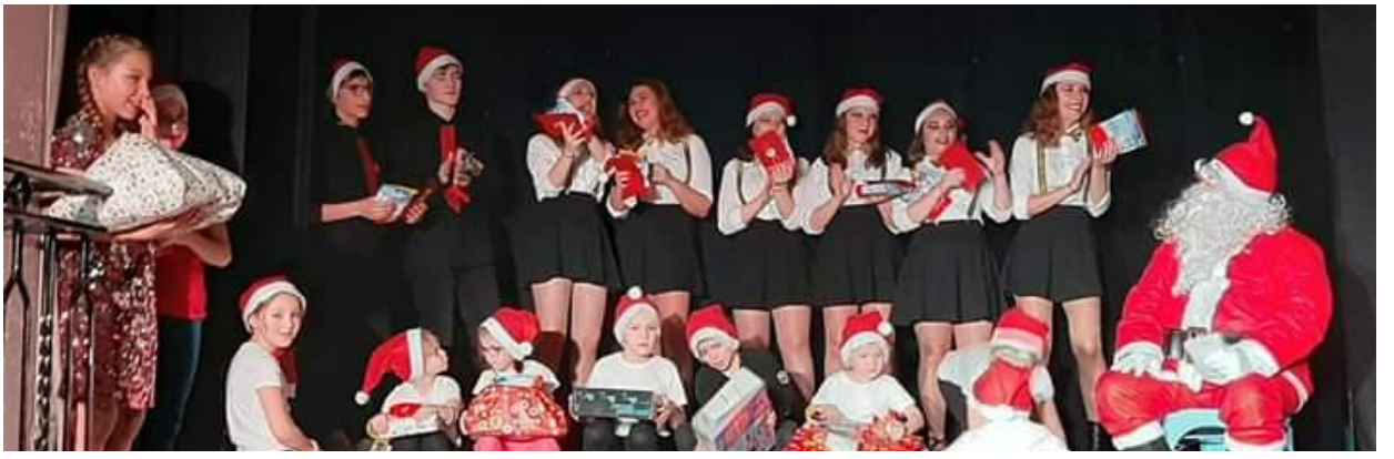
6ème Bulletin d'informations municipales – 2020 (édition spéciale)