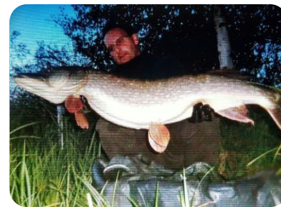
Pêche d'un brochet dans les étangs de Frise

La commune de Frise propose la location de parcelles pour pêcher situées dans le fond de l'île de Frise. Différents types de lots sont disponibles et vous pouvez vous rapprocher de la mairie pour tout renseignement complémentaire. Notre site www.commune-frise.fr est également à votre disposition avec une rubrique consacrée.