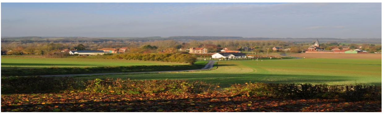
2 Eme Bulletin d'information – 2016