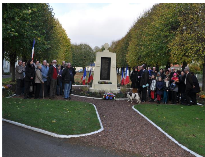
Commémoration du centenaire (archive 2014)