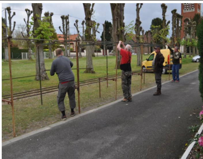
Préparatifs - Réderie