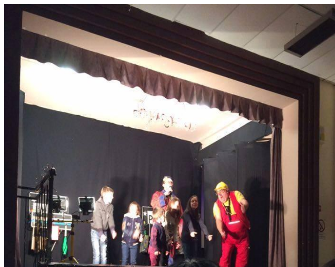
Spectacle de Noel