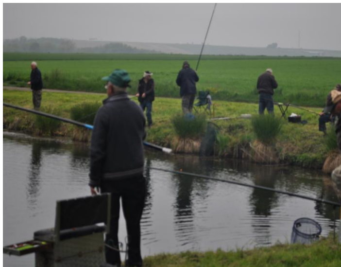
Journée pêche a la truite