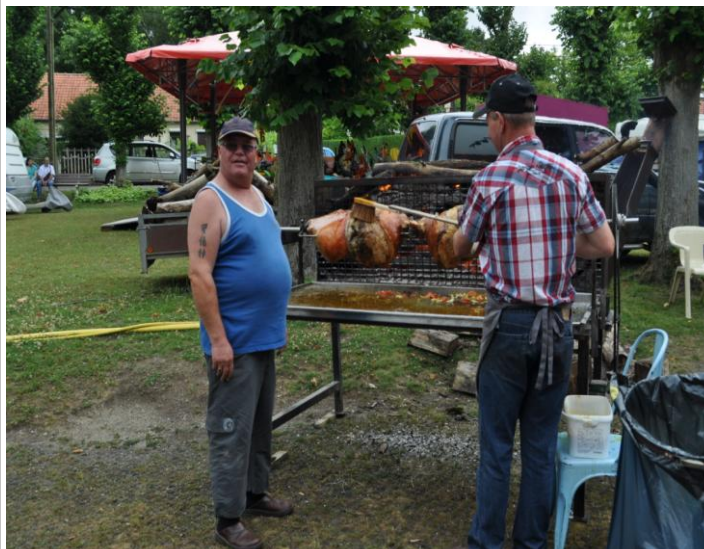
Rederie fête locale