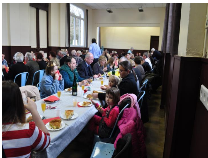
Vœux de la municipalité