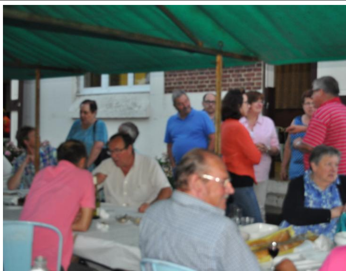
Lendemain fête locale